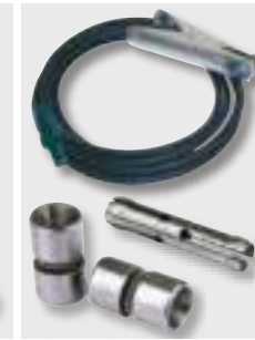
V opcii obdržíte: Uzemňovací kábel, pružné krúžky jednotlivých veľkostí upínacieho segmentu