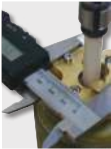
Jednoduché a precízne nastavenie pozície elektródy