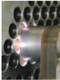
Vysokokvalitný výsledok na vodorovne alebo zvislo uložených trubkách