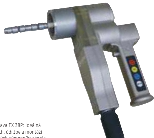
Zváracia hlava TX 38P: Ideálna pri opravách, údržbe a montáži priemyselných výmenníkov tepla