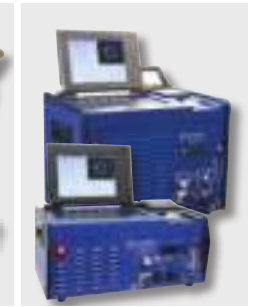
Perfektný doplnok: Zdroj zvaracieho prúdu ORBITAL CA-série