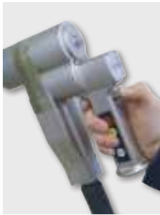
Ovládanie len jednou rukou integrovanými ovládacími tlačítkami a tlačítkom ovládania tlakového vzduchu priamo v ruke