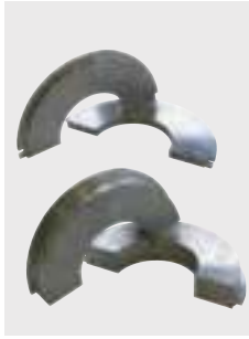
Cenovo výhodné sady čelustí