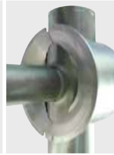
Uchytávacie čeluste pre T-kusy s možnosťou uchytania hrdla a konca zváranej trubky