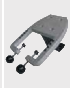
Praktický a stabilný držiak na stôl z hliníka