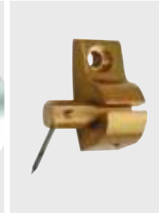
Adaptér elektródy pre bočné nastavenie wolfrámovej elektródy