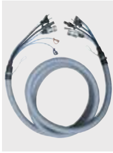
Vysoko pružný káblový zväzok hadice s možnosťou predĺženia až do 20 m (64 ft)