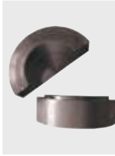
Komorové uchytávacie čeluste pre tvarovky pre zváranie tvarových kusov