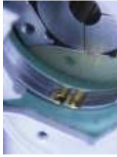
Jednoduchá montáž elektródy pomocou označenia priemeru 1,0/1,6 mm (0.039"/0.063")