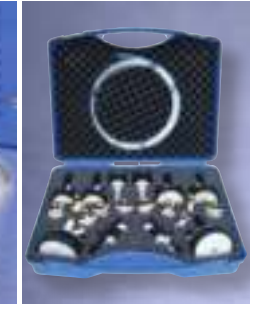
Široký sortiment príslušenstiev, napr. formovacia sada ORBIPURGE