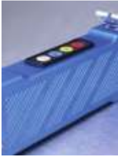
Robustná a stabilná hliníková rukoväť s integrovaným ovládaním