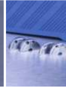
Široký rozsah priemerov nerezových čelustí (jednotl. 6-dielnych, široké a úzke) osobitne k dispozícii