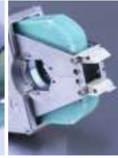
Zaklápací kryt zväracej hlavy "FlipCover"