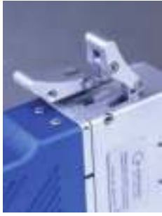
Praktický upínací zámok pre komfortnú ručnú obsluhu