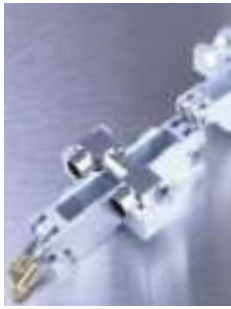
Rýchlopínací systém uchytávacích kaziet