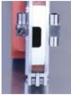
Ideálne pre zváranie všetkých typov mikro fittingov