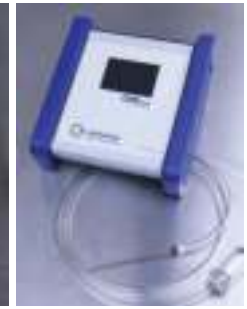
Široký sortiment príslušenstiev, napr. ORBmax prístroj pre meranie zbytkového kyslíka