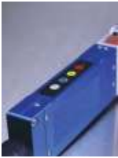
Robustná a stabilná hliníková rukoväť s integrovaným ovládaním