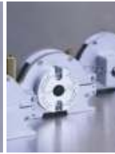
Špecifické priemery uchytávacích kaziet - osobitne k dispozícii