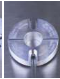
Hliníkové uchytávacie sady pre OW 12, typ "B" (široké) osobitne k dispozícii