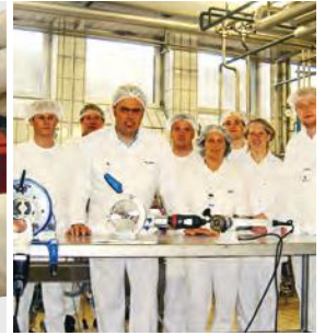
Oblasť použitia je predovšetkým v potravinárskom priemysle, výroba nápojov, farmaceutickom a chemickom priemysle