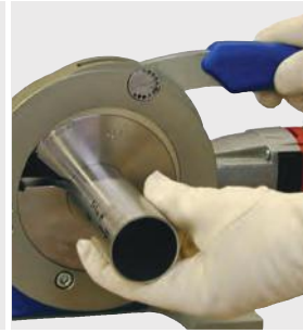
Systém rýchlej výmeny nástrojov, uchytávacích čelustí a trubiek