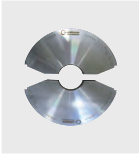
Veľký výber uchytávacích pološálok