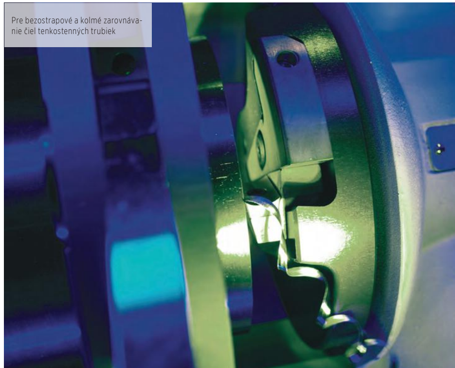
Pre bezostrapové a kolmé zarovnávanie čiel tenkostenných trubiek

Pre ručné zvarovanie je vysokokvalitné opracovanie konca trubky žiaduce z dôvodov hospodárnosti, pre automatizované zvarovanie "orbitálne zvarovanie" je vysoká kvalita opracovania konca trubky z technických dôvodov nevyhnutná. Firma Orbitalum vyvinula pre túto prípravu stroje pre čelné zarovnávanie trubiek RPG 4.5, RPG 4.5 S a RPG 8.6. Optimálne riešenie pre požadovanú, vysokokvalitnú prípravu trubiek pre orbitálne zvarovanie!