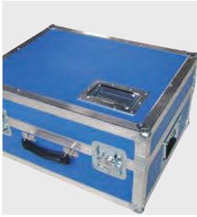
Dodávajú sa v pevných prepravných kufoch