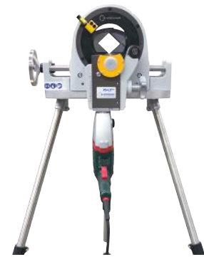
PS 4.5 Plus

Technické údaje sú bez záruky. Neobsahujú žiadne vlastnosti. Zmeny vyhradené. Platia naše všeobecné predajné podmienky.