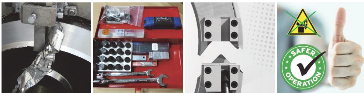
Dostatočne mohutné tvarové nože

* Verzie strojov väčšie ako 24 inch: budú uведенé na trh v marci 2016.